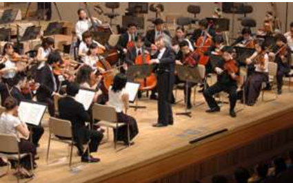
サイトウネソノフェスティバル