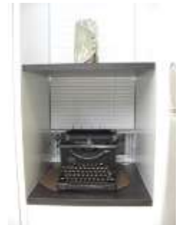
60年前のタイプライターが 自分の居場所をみつけて しっかりと収まっています