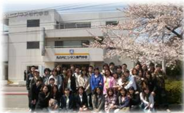
桜が咲くとお花見