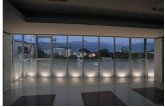
夜景 松本城が目の前に見えます。