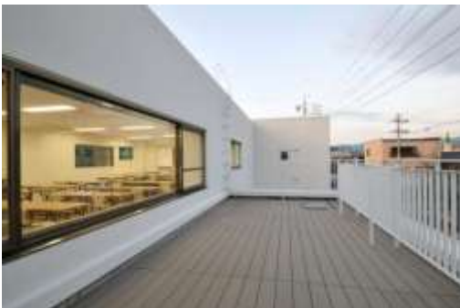
夏には涼しそうなルーフテラス