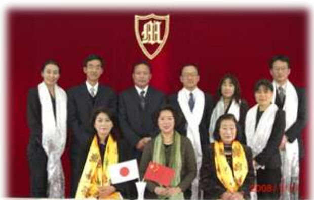
2008.1 青海民族学院外国語学院との提携