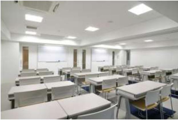
2階と3階は、教室です。 OAフロアの快適なパソコン教室そして、光あふれる普通教室 3階は、あけ放すと150名の講演会場にもなります。