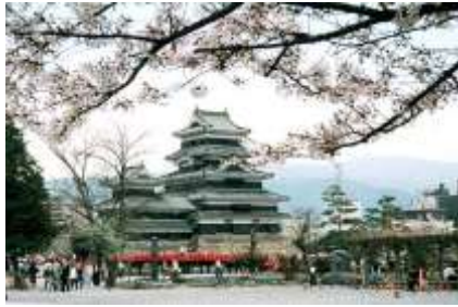
松本城（教室からすぐ見えます）