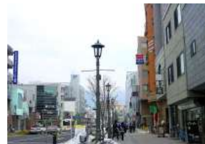
松本市内の街並み